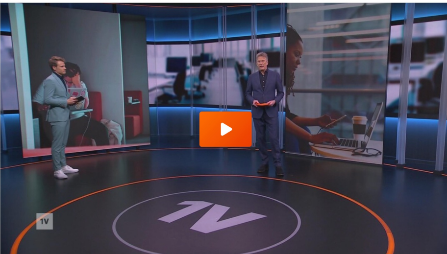
Tv-presentatie over werkstress.